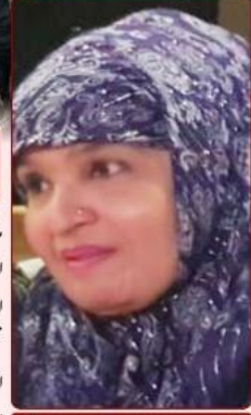
تحریر و ترتیب: فریدہ خانم