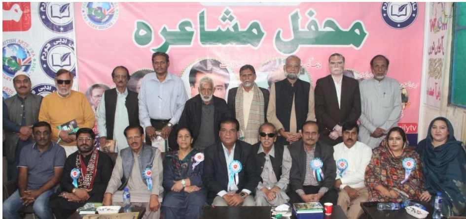
Monthly Mushaira December, 2023: